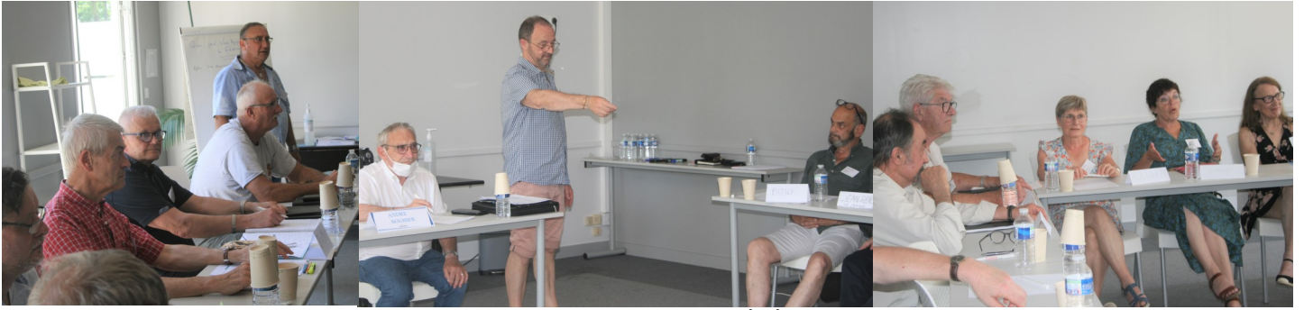
L'atelier Mobilisation des bénévoles