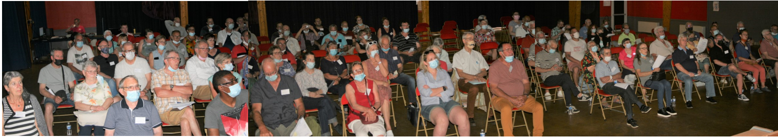
Réunion plénière du vendredi 11 juin, présentation de l'organisation du séminaire

Voici la restitution des ateliers. Chaque participant du séminaire national avait participé à deux ateliers différents. Chaque atelier était proposé deux fois.