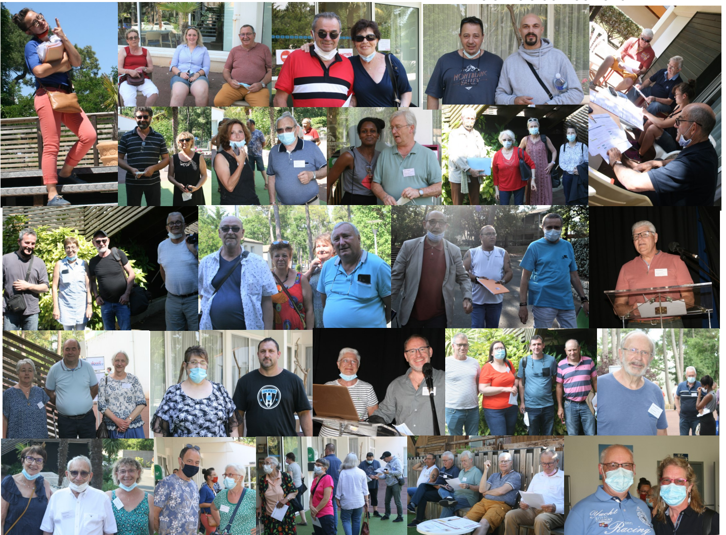
Pêle mêle du week-end