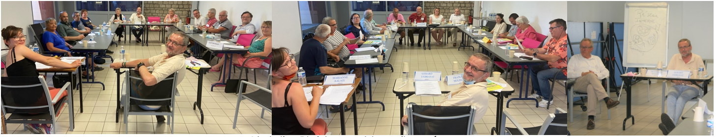
L'atelier Plaidoyer et travail en réseau