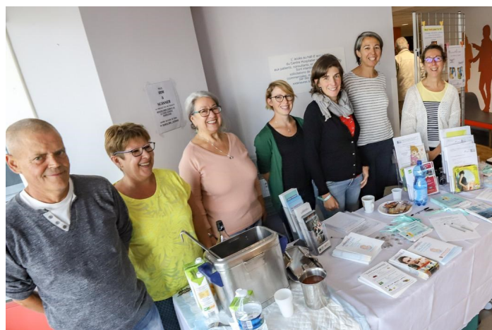
Une journée sur la prévention de l'alcoolisation fœtale était organisée dernièrement à l'hôpital de Guéret.